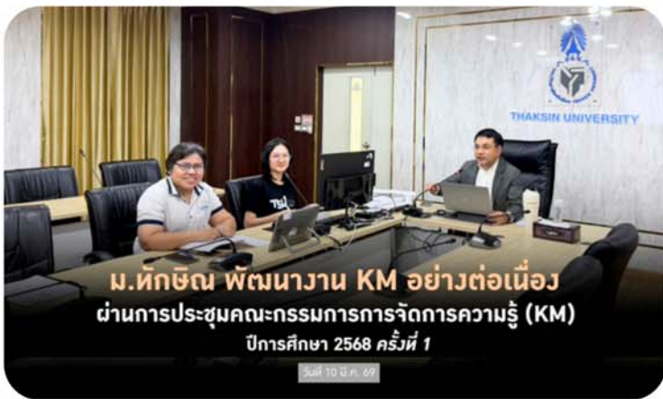
ม.ทักษิณ พัฒนางาน KM อย่างต่อเนื่อง ผ่านการประชุมคณะกรรมการการจัดการความรู้ (KM) ปีการศึกษา 2568 ครั้งที่ 1

หารือแนวทางและวางระบบการจัดการความเสี่ยงร่วมกับโรงเรียนสาธิต ม.ทักษิณ ฝ่ายมัธยม เพื่อร่วมแลกเปลี่ยนความคิดเห็นและวางแนวทางการบริหารจัดการความเสี่ยงของโรงเรียน ให้เป็นไปตามหลักเกณฑ์อย่างมีประสิทธิภาพและเกิดความเข้าใจในทิศทางเดียวกัน